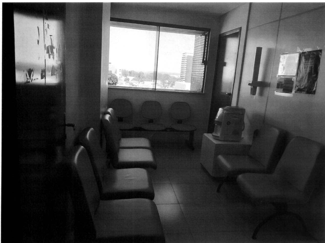
Recepção da Subseção.