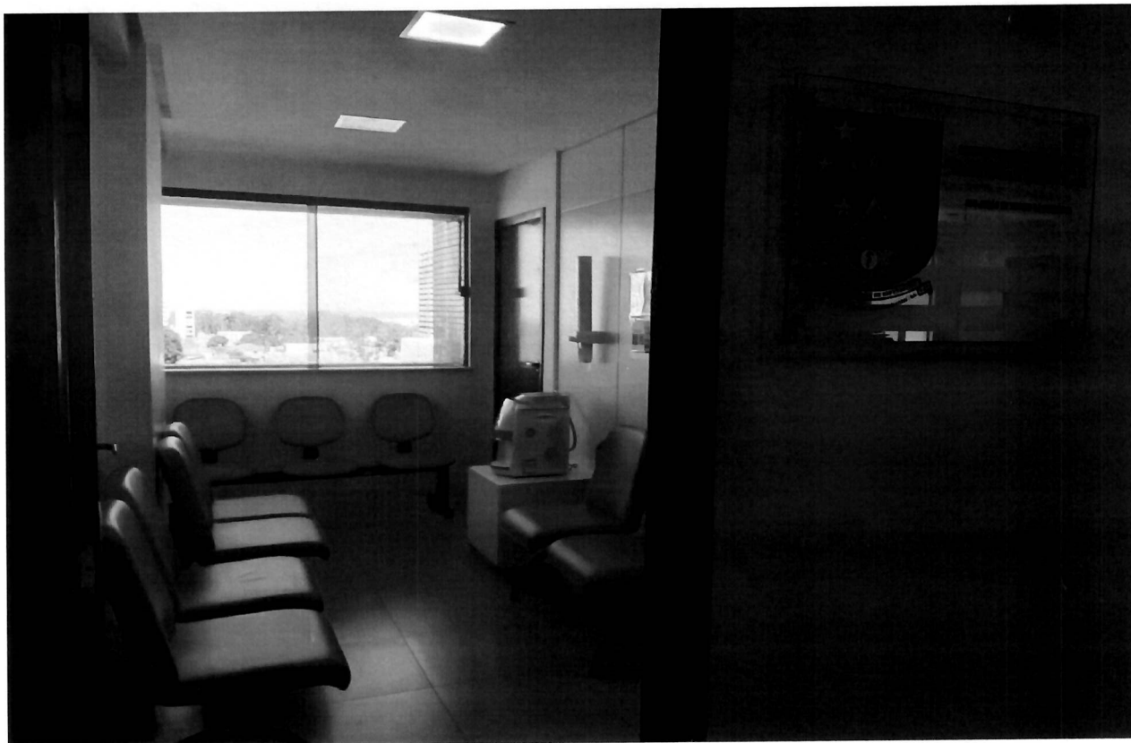
Entrada e recepção da Subseção do Conselho Regional da Bahia em Vitória da Conquista Bahia. Lotado no Candeias Medical Center, 4 andar sala 404.