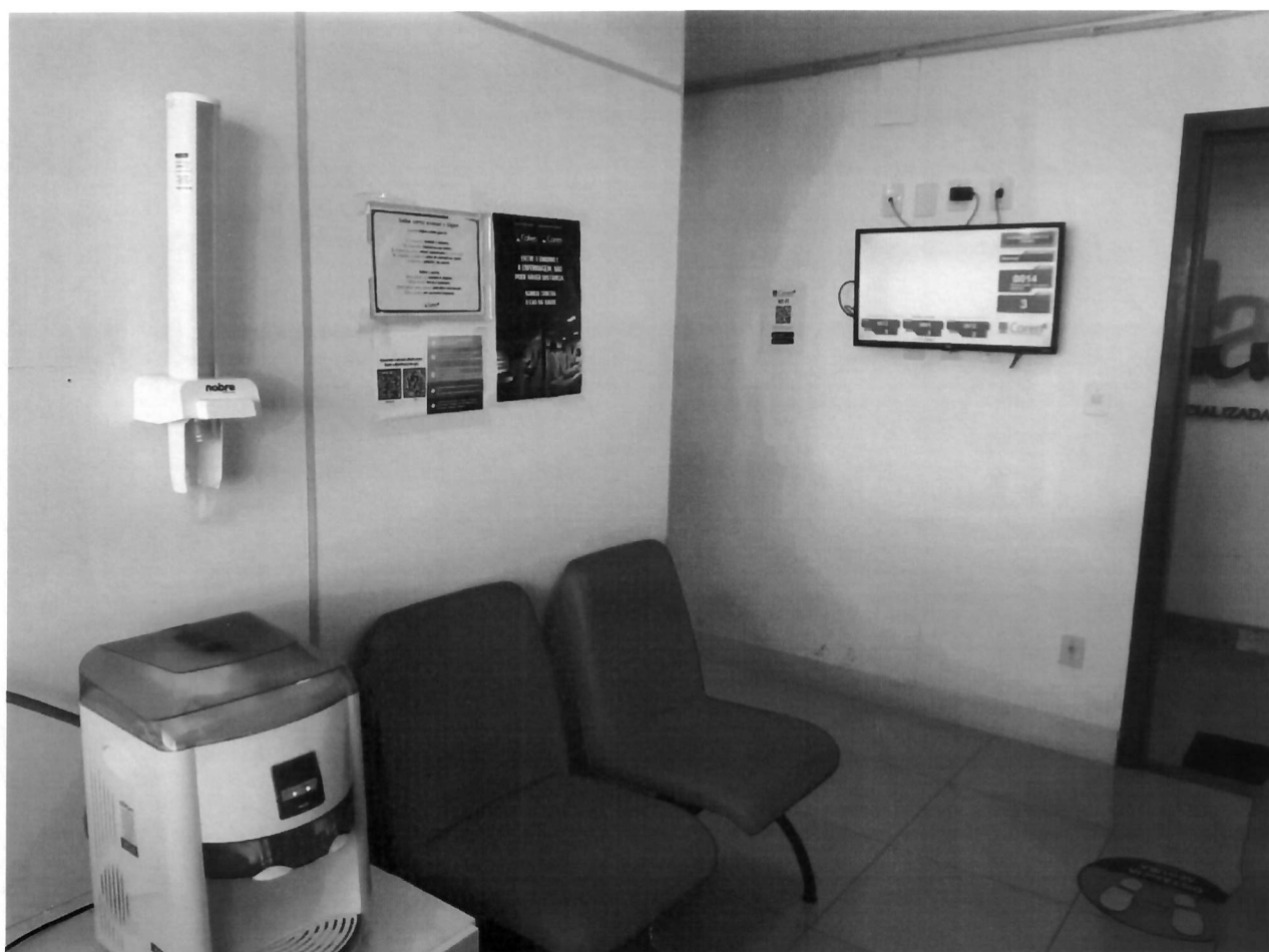
Recepção da Subseção.