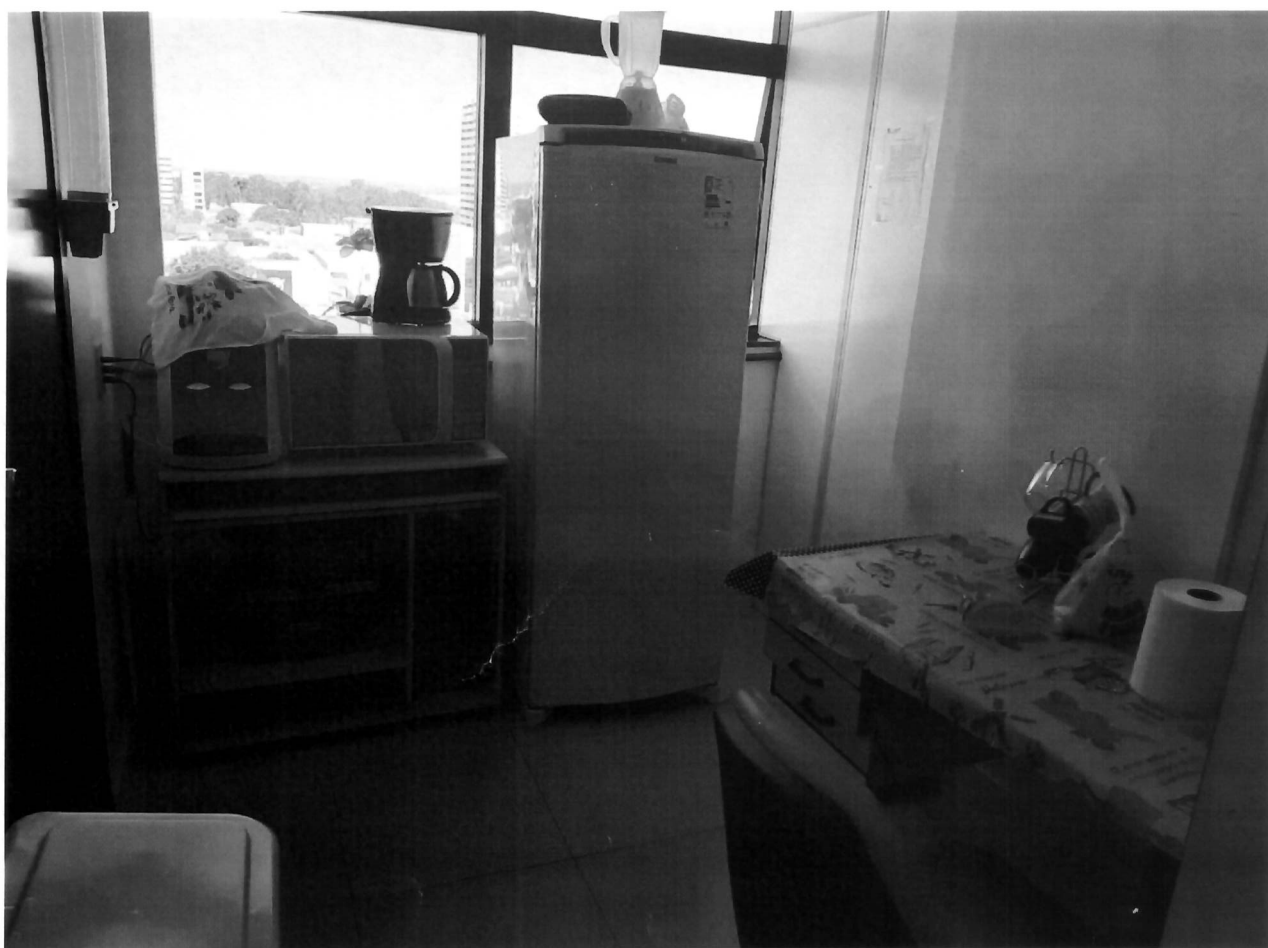
Copa e local com armário com o arquivo morto.