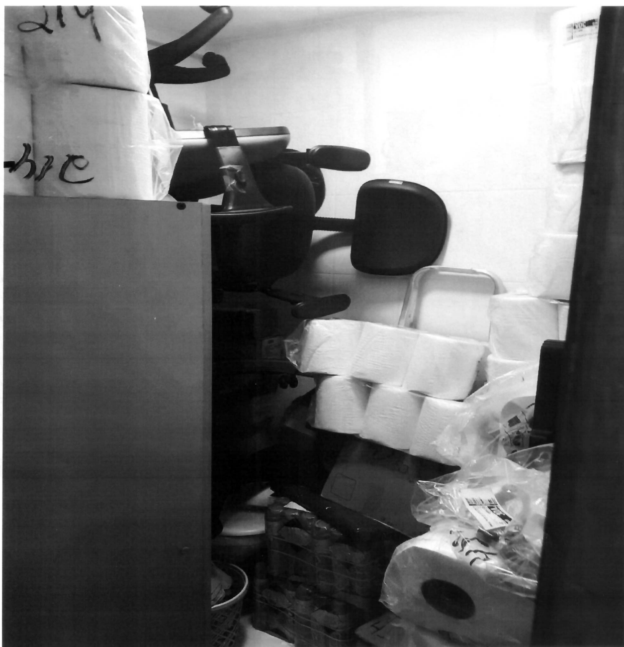
Almoxarifado e local para armazenamento do arquivo morto.