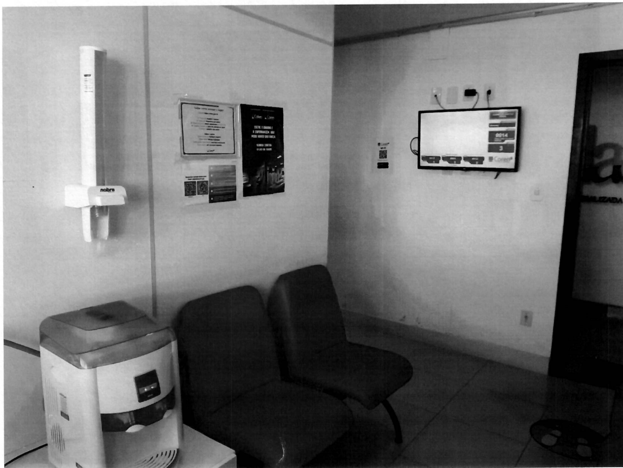
Recepção da Subseção.