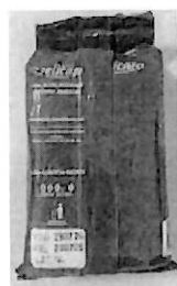
CAFÉ DELICATO (4).jpeg 78K