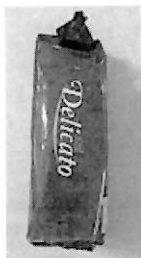
CAFÉ DELICATO (3).jpeg 50K