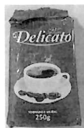
CAFÉ DELICATO (5).jpeg 64K