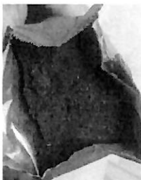
CAFÉ DELICATO (1).jpeg 103K